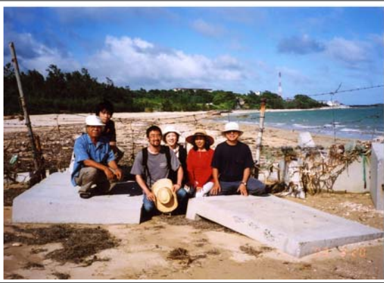
海上基地がつくられようとしている辺野古の海